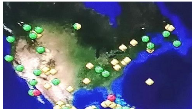
USA - obiekty wpisane na Listę Światowego Dziedzictwa UNESCO

Omówienie przykładów poprzedzono prezentacją pierwszej ustawy dotyczącej ochrony zabytków w USA, czyli tzw. Ustawy o Starożytności opracowanej przez administrację Theodore'a Roosevelta w 1906 roku. Prawdziwym jej osiągnięciem była możliwość ustanawianie systemu ochrony bez zgody Kongresu. Położyła podwaliny pod dalsze ustawodawstwo federalne mające na celu ochronę zasobów kulturowych należących do domeny publicznej; siedemdziesiąt trzy lata po uchwaleniu prawa Kongres zrobił kolejny krok w tym kierunku, uchwalając Ustawę o Ochronie Zasobów Archeologicznych z 1979 r.