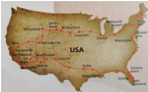
Trasa wyprawy w 2016 roku.

Przedmiotem wykładu były obiekty poznane przez autorkę w czasie wyprawy do USA w 2016 roku. Był to jeden z wyjazdów z cyklu „Szlakiem miejsc zabytkowych w tym wpisanych na Listę Światowego Dziedzictwa UNESCO . Inne wyprawy to: Indie, Nepal (2002); Kostaryka, Nikaragua, Honduras, Gwatemala, Belizé, Meksyk (2003); Liban, Syria, Jordania (2005); Etiopia (2007); Australia, Nowa Zelandia (2017), Chile, Urugwaj, Paragwaj, Argentyna, Brazylia (2018). Zostały zaprezentowane zarówno wybrane obiekty wpisane na listę oraz inne zabytki tzw. pomniki narodowe USA.